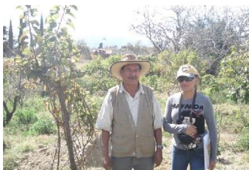
Figura 7. Productor entrevistado en su huerta

Si bien es cierto que su actividad económica es la agropecuaria, existe una alta diversificación, que va desde el maíz y el frijol, la calabaza y los frutales; de estos últimos pueden tener en una misma huerta al menos hasta siete especies diferentes como: tejocote, durazno, ciruela, pera, nogal, manzana, chabacano y capulín, mismos que comercializan durante todo el año de acuerdo a la temporada de cosecha de cada frutal, como puede apreciarse en la figura 7 en una de las huertas visitadas en donde se observan árboles de nogal, chabacano, higo y durazno. Por lo que podemos observar que, los productores de esta subregión han encontrado y desarrollado una estrategia local para resolver los desafíos que representa la dinámica económica y mejorar sus ingresos; esta estrategia esta sustentada en conocimientos locales y su experiencia personal que se entretajan en una red de información entre los diferentes productores que les facilita la venta de productos. Las actividades anteriormente descritas pueden complementarse con la elaboración de artesanías, maquila, producción de loza y elaboración de sidras y vinos.