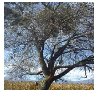
Figura 4. Árbol de capulín en invierno