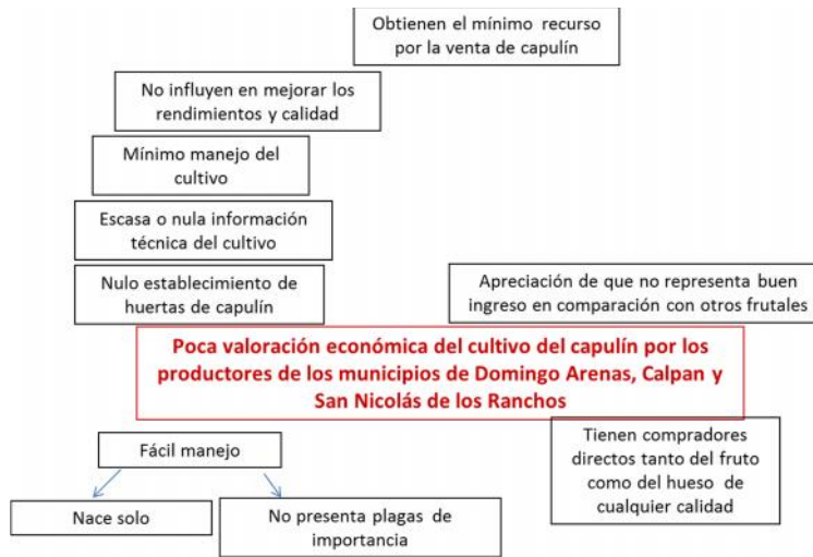
Figura 5. Árbol de problemas

En relación a la información recaba durante el estudio, en los diferentes municipios, se identificó como problema primordial la poca valoración económica del cultivo de capulín por los productores (ver figura 5).