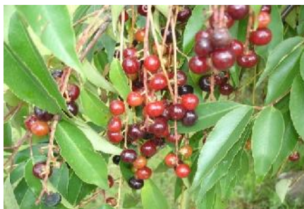
Figura 3. Fruto de capulín

En relación a la subregión de estudio, se optó por la condición de que en ellas hubiese necesariamente agricultores que participen activamente en la producción frutícola, que alguna parte de la producción se destine al mercado y que exista distribución o acopiadores de frutales entre ellos capulín. Los datos que se presentan se describen de manera general tomando en cuenta una media o promedio de las características en conjunto de las poblaciones de la subregión, de acuerdo a los datos obtenidos en INEGI (2012, a, b, c).